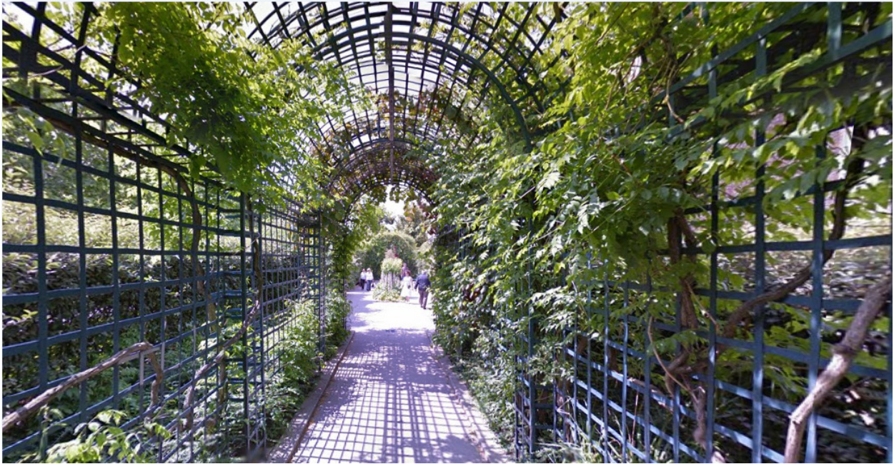
Promenade Plantée, Paris