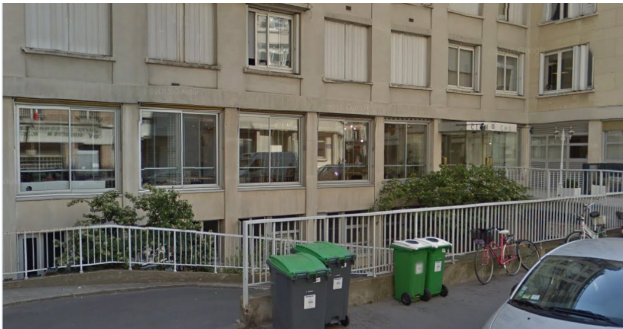
Rue Jean Bart, Paris